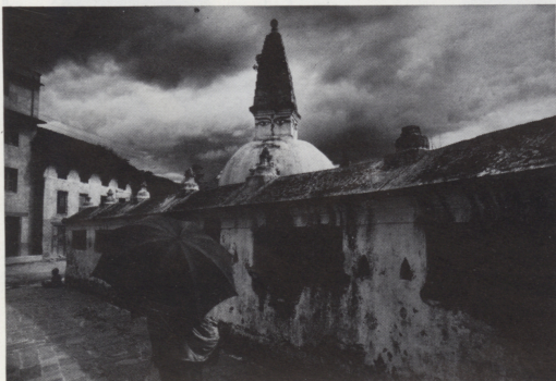
Stupa und Schirm